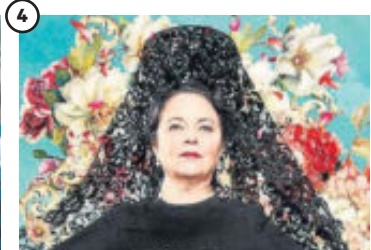
4 'Mi querida cofradía' Una devota católica se lleva un disgusto al no ser elegida Hermana Mayor de su cofradía durante la Semana Santa malagueña. Es el arranque de esta comedia costumbrista, debut de Marta Díaz de Lope. Estreno: 4 de mayo.