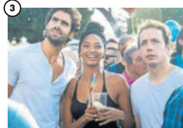
3 'Las leyes de la termodinámica' Ciencia aplicada a las relaciones de pareja. Esto es lo que pretende el experto en física Manel (Vito Sanz), en el reparto con Berta Vázquez y Chino Darín. Mateo Gil ganó la mejor dirección en el Festival de Miami. Estreno: 20 de abril.