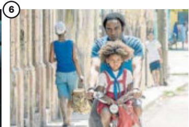
6 'Sergio & Serguéi' 1991, la URSS está a punto de desaparecer y Cuba en plena crisis. Un profesor de filosofía y radioaficionado inicia una curiosa amistad con el cosmonauta soviético Serguéi Krikaliov. De Ernesto Daranas Serrano. Estreno: 20 de abril.