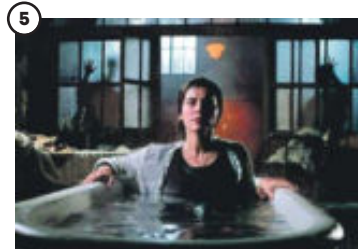
5 'No dormirás' Después de La casa muda (2010), rodada en un único plano secuencia, el uruguayo Gustavo Hernández vuelve con la historia de un grupo de teatro que ensaya en un psiquiátrico abandonado. Con Belén Rueda y Natalia de Molina.